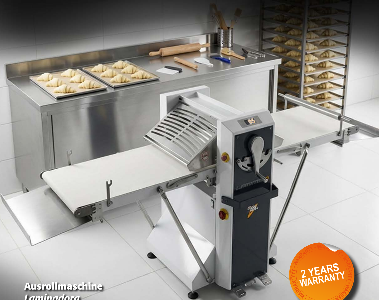
Ausrollmaschine Laminadora Sfogliatrice